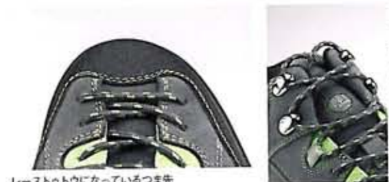
レーストゥウになっているつま先