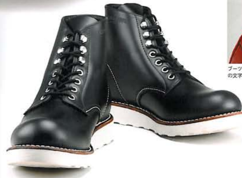
ベージュのほかにブラックもラインアップされている