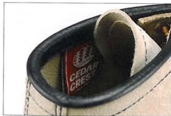
履き心地を考慮して、トップエンドはロールドトップになっている

北アフリカに生息するFennecの名前を冠したモカシンブーツ。きれいな薄茶色のフェネックのようにアッパーにはベージュ色のラフアウトとしている。アウトソールはオリジナルラバーソールを採用している サイズ：25.5~27、28cm 価格：¥13,440