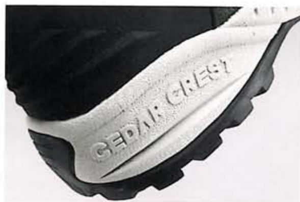
ソール側面にはCEDAR CRESTの文字が入っている