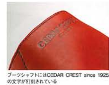
ブーツシャフトにはCEDAR CREST since 1925の文字が打刻されている