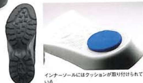
インナーソールにはクッションが取り付けられている