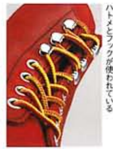
ハトメとフックが使われている