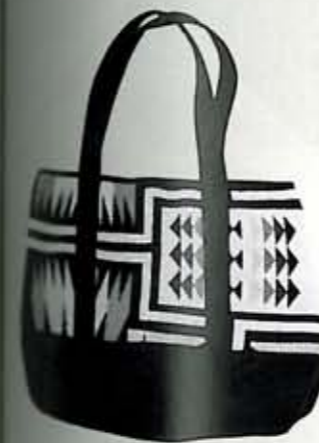
NATIVE RAG TOTE

天高く大樹が聳えるグレートスモーキーマウンテンの麓で、ロガーやファクトリーワーカーのためのワークブーツブランドとして1925年に誕生したセダークレスト。やがて労働者を護るワークイクエブメントのメーカーからカジュアルの分野にまでそのフィールドを拡大。アウトドアをベースとした総合ブランドへと成長を遂げた。アメリカンカジュアルの普遍性、そしてデイリーに身に著けたいリーズナブルなプライス。セダークレストはシチュエーションを問わず、デイリーに身に著けたいアイテムをリリースし続けている。