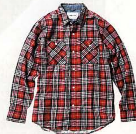
DOUBLE GAUZE SHIRT

アウトドアの生地を使用したトートバッグは底マチに厚手の生地を使用することで、しっかりとした使い心地。大容量のためアウトドアにも重宝する。5990円